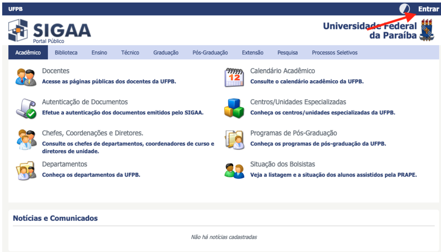
Figura 1 - SIGAA UFPB (Portal Público)

4. Em seguida, clique em "Cadastro / Recuperação Acesso" (Figura 2)