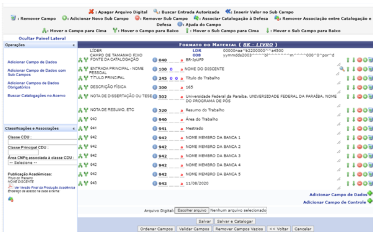
Figura 35 – Catalogação da Produção Acadêmica

Para cadastrar o título no acervo da UFPB é necessário selecionar a opção Importar para o Acervo . A tela apresentada na Figura 35 é apresentada ao usuário, permitindo que o mesmo insira os campos MARC.