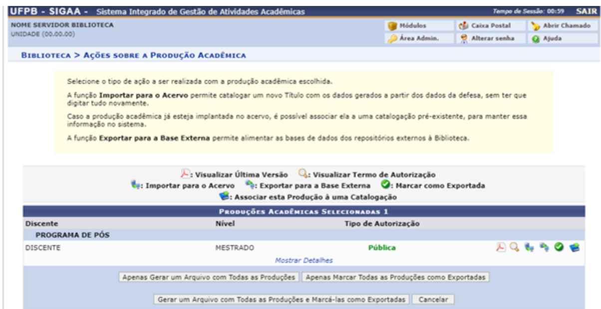
Figura 34 – Tela de ações sobre a Produção Acadêmica

As ações que podem ser realizadas são: Visualizar Última Versão , Visualizar Termo de Autorização , Importar para o Acervo , Exportar para a Base Externa , Marcar como Exportada e Associar esta Produção a uma Catalogação .