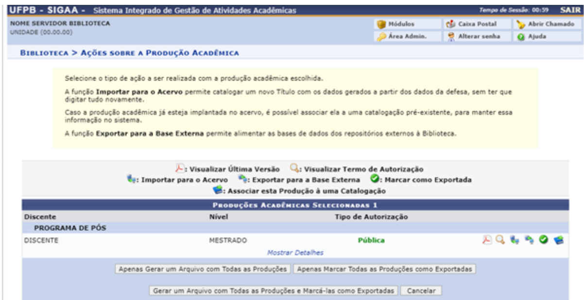
Figura 34 – Tela de ações sobre a Produção Acadêmica

As ações que podem ser realizadas são: Visualizar Última Versão , Visualizar Termo de Autorização , Importar para o Acervo , Exportar para a Base Externa , Marcar como Exportada e Associar esta Produção a uma Catalogação .