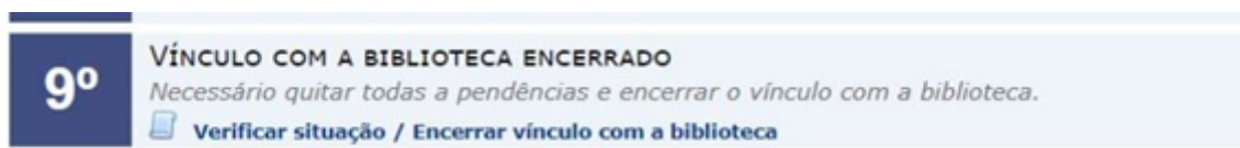
Figura 29 - Etapa de verificação de vínculo com a Biblioteca

Nesta etapa é o momento para o discente verificar se existem pendências como as bibliotecas, tais como empréstimos e multas vigentes. Somente após a quitação de pendências, caso haja, o discente poderá então solicitar o encerramento de vínculo do referido curso de pós-graduação (Figuras 29, 30 e 31).