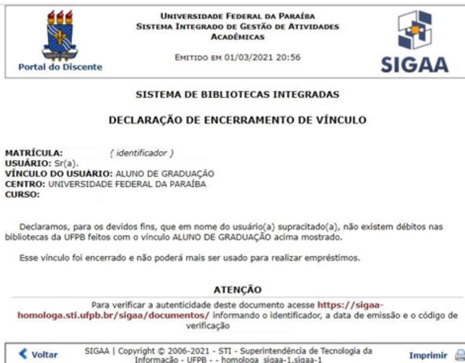
Figura 31 – Declaração de encerramento de vínculo com a Biblioteca