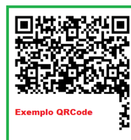
Figura 5 - QRCode no PDF da representação visual

Portaria de Credenciamento/Recredenciamento da instituição n.º 60, de 18/01/2017, seção 1, página 14, publicada em 19/01/2017.