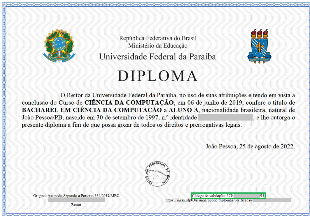
Figura 2 - Código de validação no PDF da representação visual

Com o código de validação, acesse a funcionalidade de validação do diploma digital pelo caminho: