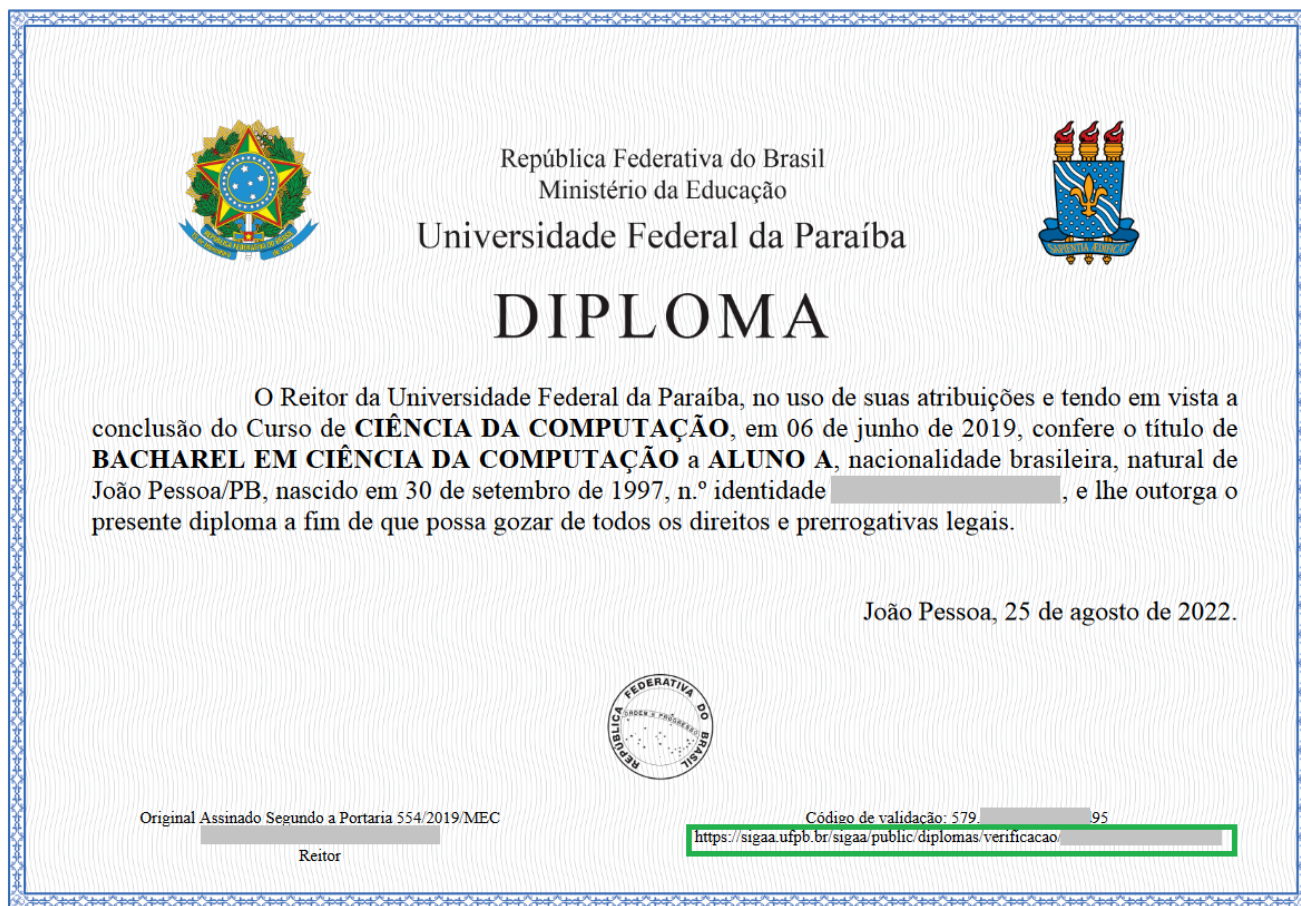
Figura 4 - Link para a página de validação de diploma digital no PDF da representação visual

No PDF da representação visual, o usuário poderá utilizar o link que está no anverso (ver Figura 4) ou utilizar o QRCode apresentado no verso (ver Figura 5).