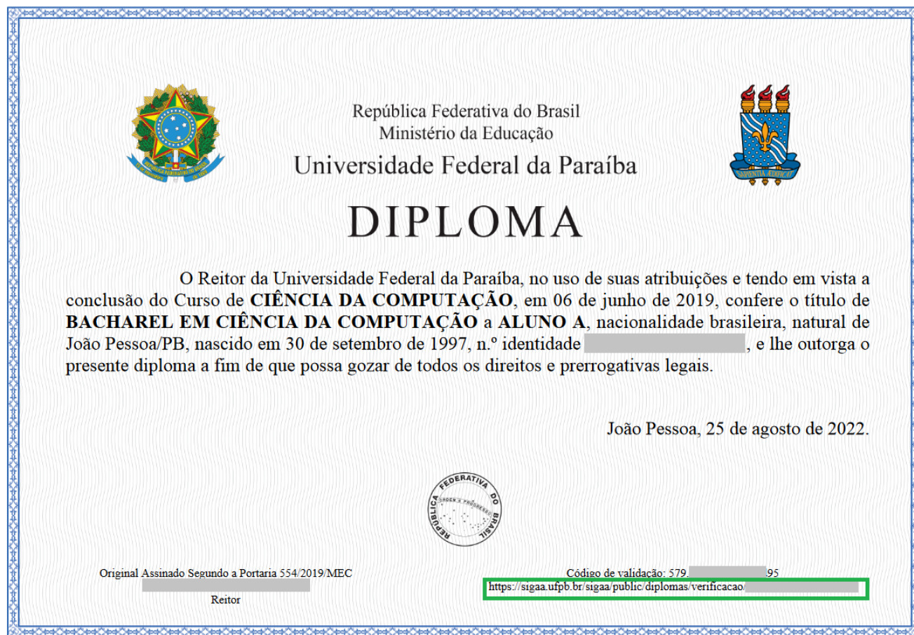
Figura 4 - Link para a página de validação de diploma digital no PDF da representação visual

No PDF da representação visual, o usuário poderá utilizar o link que está no anverso (ver Figura 4) ou utilizar o QRCode apresentado no verso (ver Figura 5).