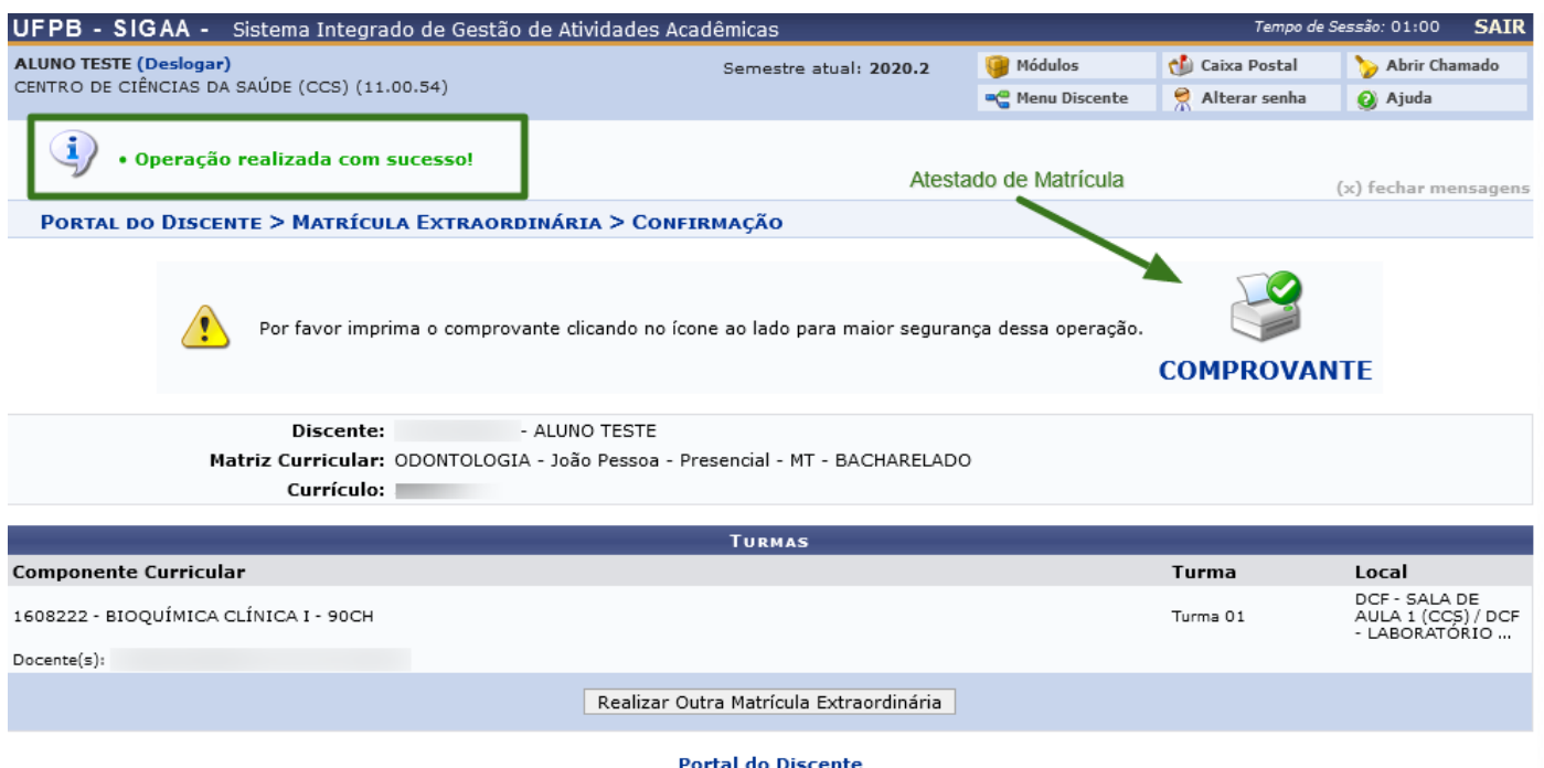
Figura 4 – Tela de Confirmação da Matrícula Extraordinária.

Como resultado desta operação, a ocupação de vagas ocorre pela ordem de chegada do discente que passar pelas validações necessárias em primeiro e obtiver mensagem de sucesso direcionada à emissão de comprovante (Figura 4).